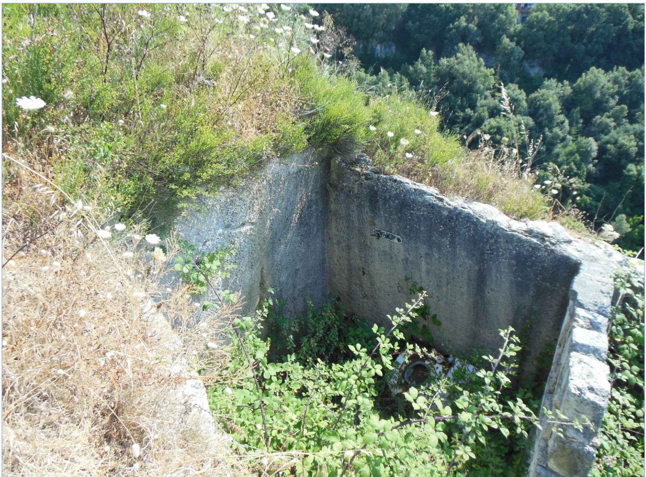
Foto 6 -Trincea di estrazione usata come discarica