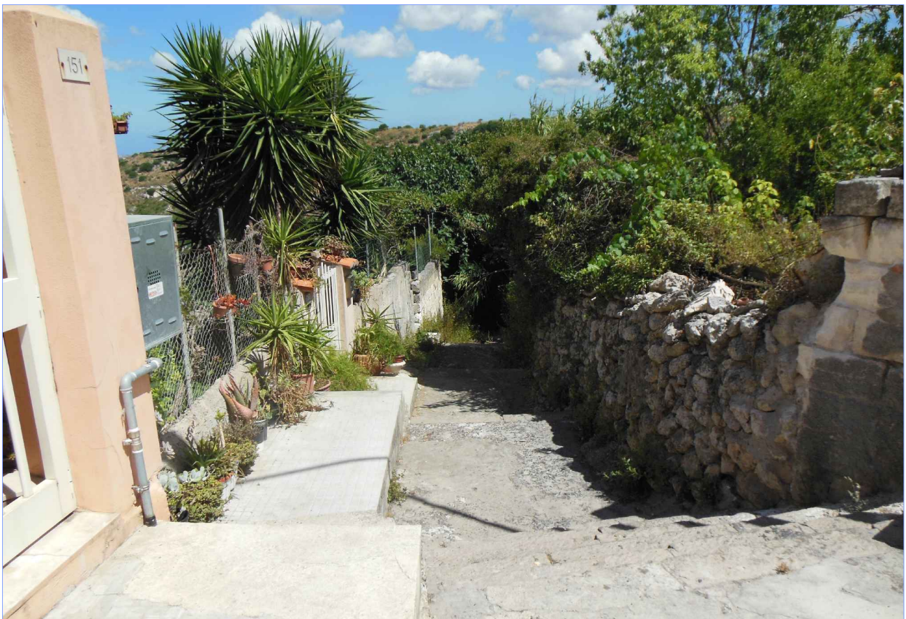
Foto 4 - Ingresso dalla via Vitt. Emanuele