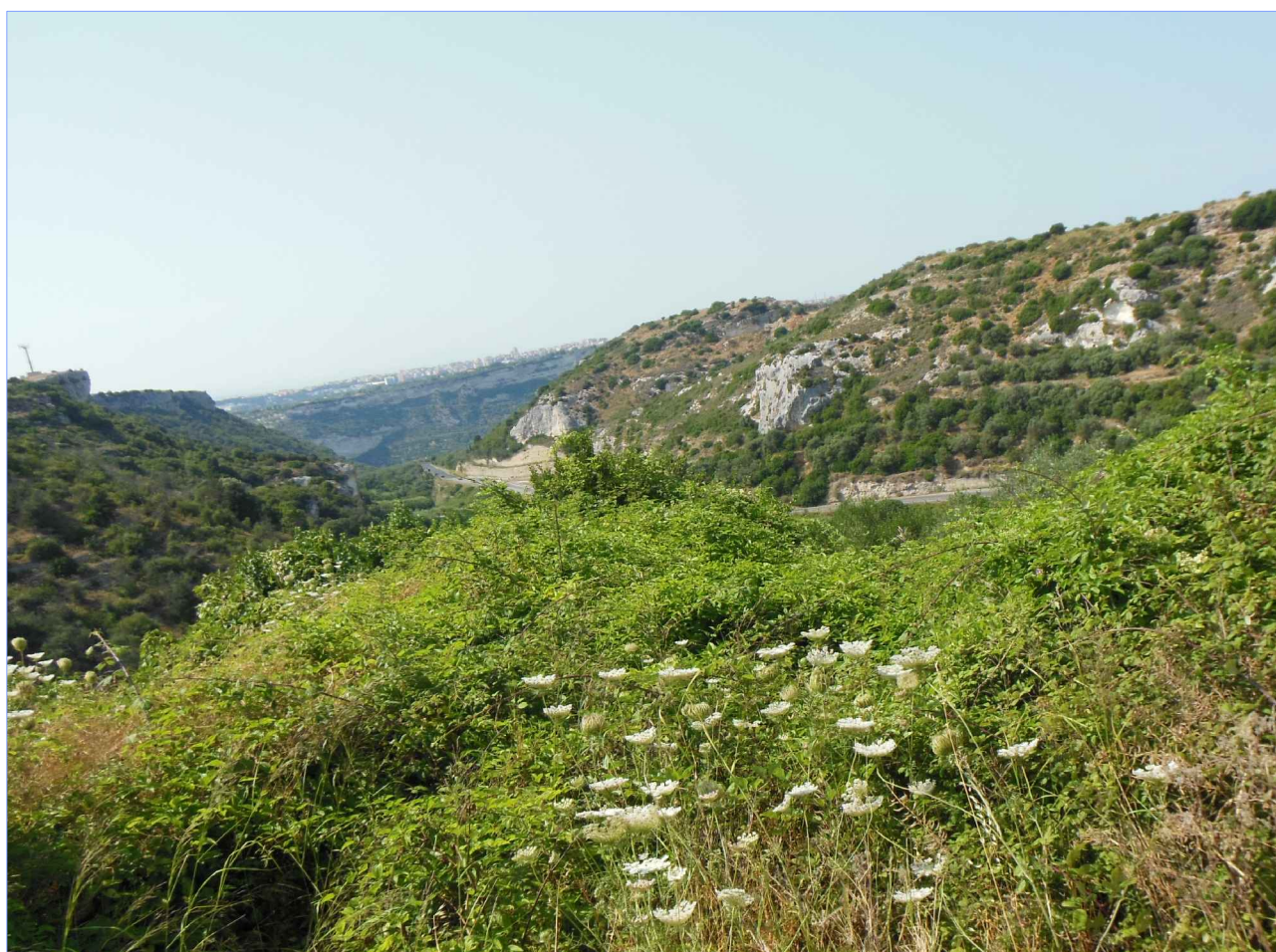
Foto 8 - Vista verso la vallata d'ingresso al paese; in lontananza la citta' di Sassari; in primo piano l'evidente abbandono e degrado del sito