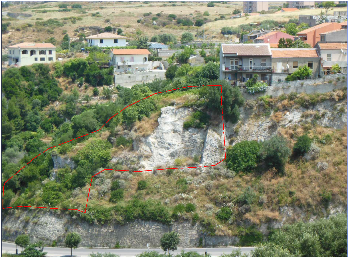
area di intervento dalla via Roma