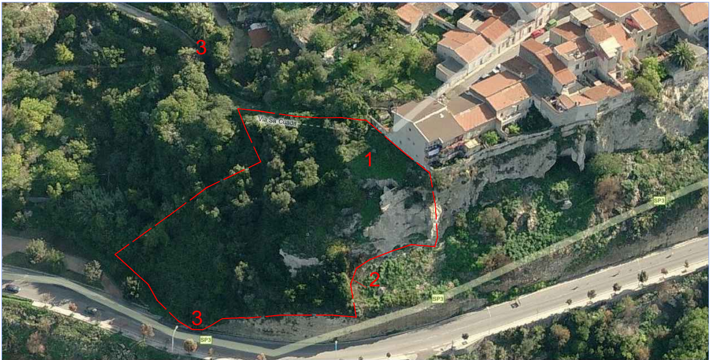
Foto aerea panoramica