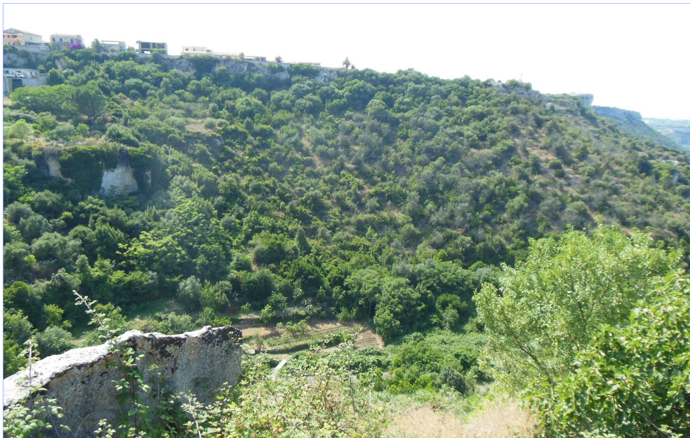
Foto 7 - Vista dal futuro piazzale belvedere