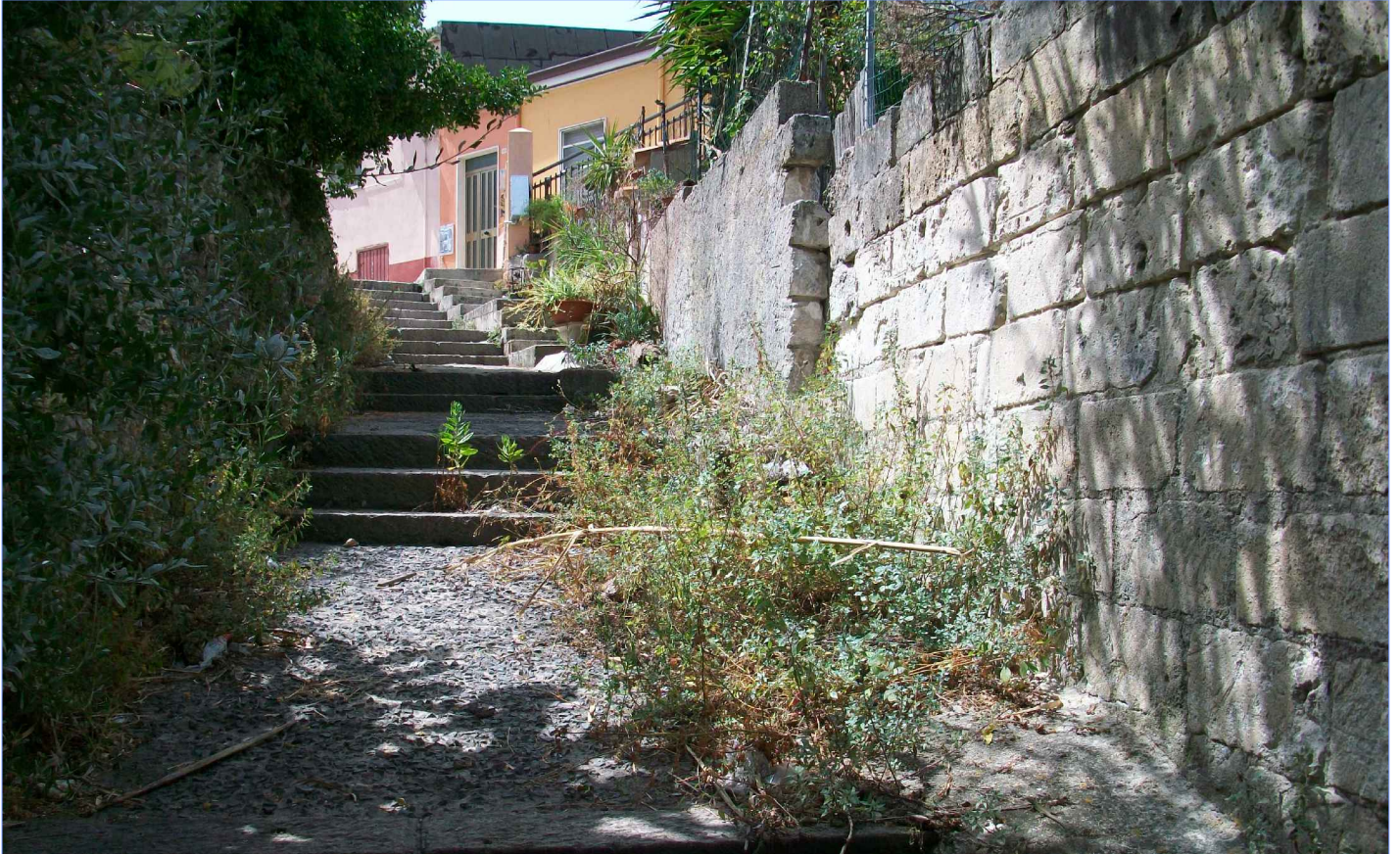
Foto 5 - scalinata ingresso dalla Via Vitt. Emanuele