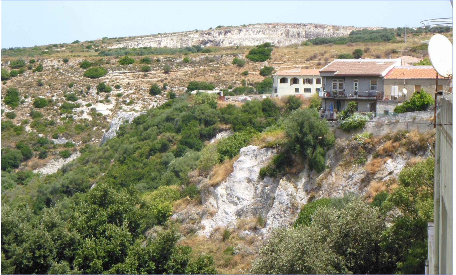
Foto 3 - vista dalla centralissima via Roma