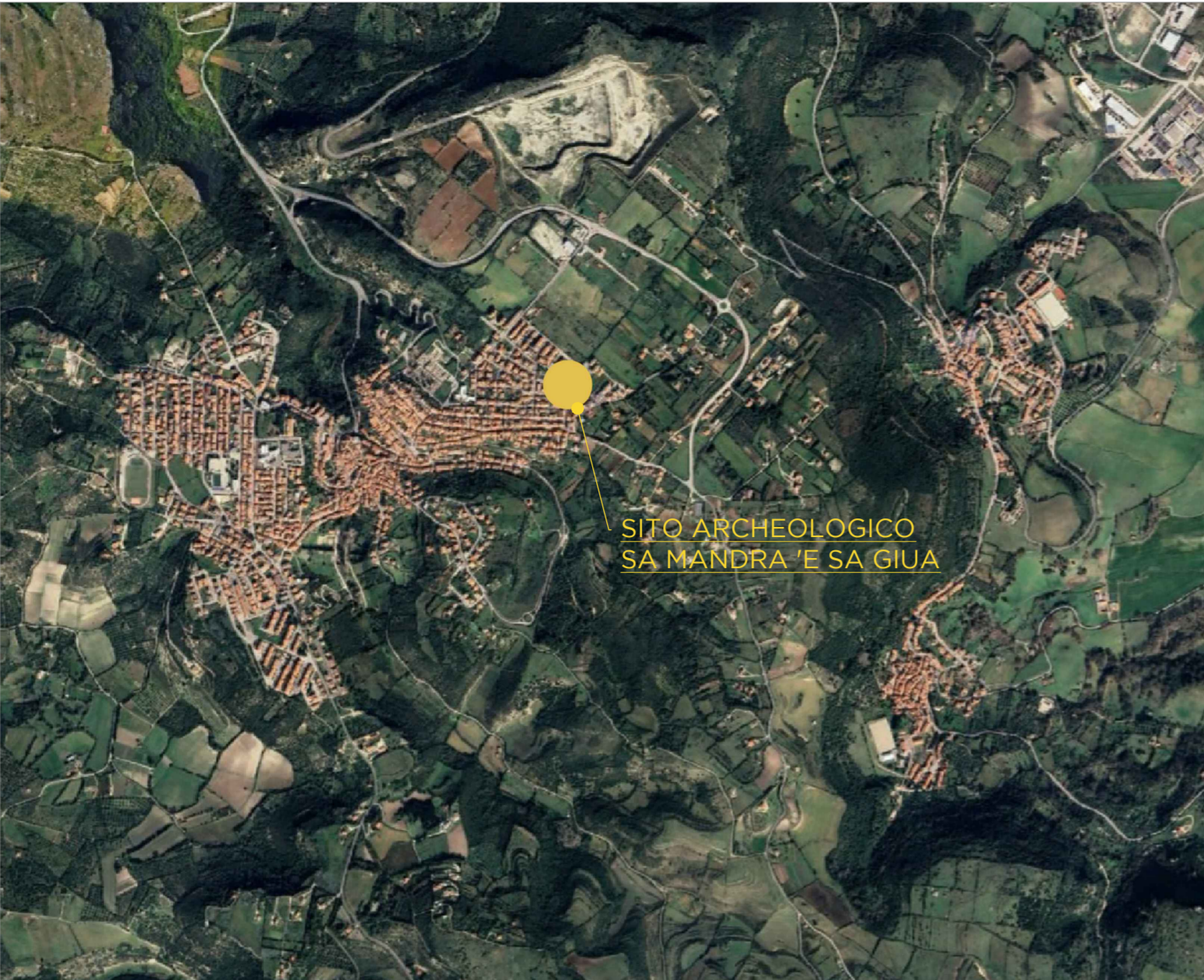
SITO ARCHEOLOGICO SA MANDRA 'E SA GIUA